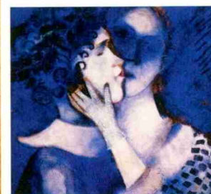
Ob Frühwerke von Chagall oder die abstrakten „Zeichen in Gelb“ (r.o.) von Paul Klee: Basel ist eine Reise wert.